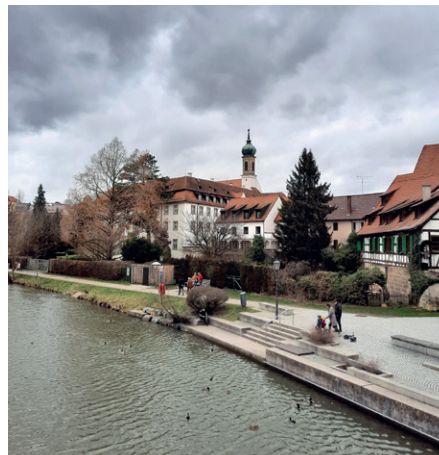
Rottenburg am Neckar – mit mittelalterlichem Stadtkern