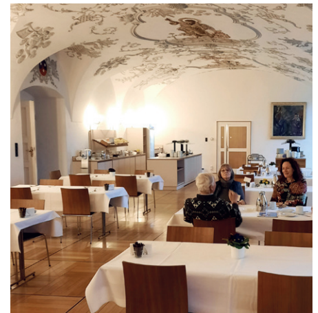
Morgenessen im Priester-Seminar, ehemaliges Karmeliter-Kloster