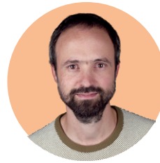
Martin Nouis Pasteur

E s heisst immer noch Bulletin. Aber es ist neu. Das erste Bulletin im Jahr 2023. Das erste Bulletin in neuer Form und neuem Erscheinungsbild. Das erste Bulletin, das die drei Gemeinden Murten, Meyriez und Môtier-Vully gemeinsam gestalten.