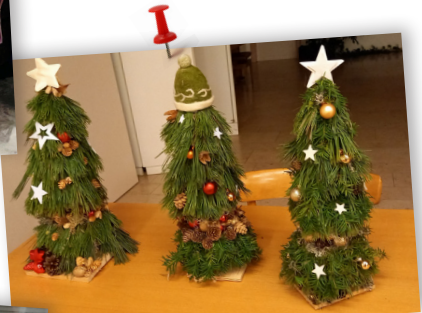
Adventsdekoration mal modern – mal traditionell