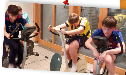
Die 24 Stunden von Meyriez