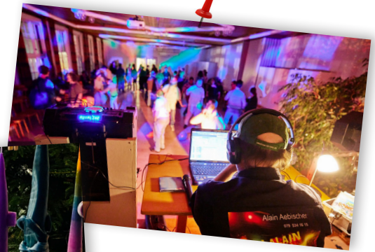
Inklusive Disco mit Tanzworkshop

16 Wahlkurse haben wir von November bis Februar durchgeführt. Unsere Jugendlichen haben mitgemacht – zusammen haben wir viel erlebt. Stellvertretend dafür hier ein paar Impressionen: