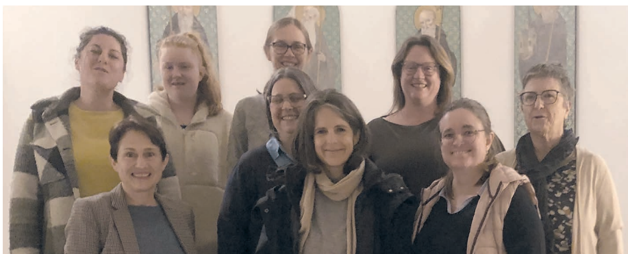
Die Sprecherinnen am WGT vom 1. März 2024